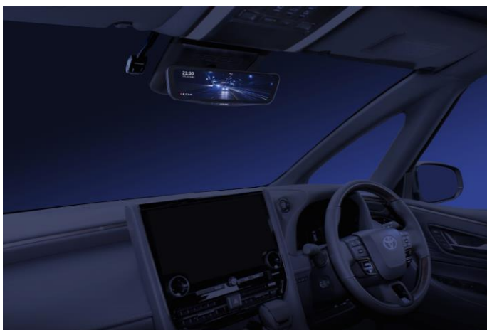
■アルファード/ヴェルファイア（40系）専用モデル 12型ドライブレコーダー搭載デジタルミラー室内装着イメージ