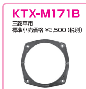
KTX-M171B 三菱車用 標準小売価格 ¥3,500 (税別)