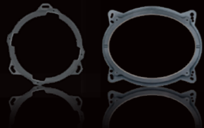
ドアへの取付けを確実にする 「インナーバッフルボード」

スピーカーとツイーターの取付けには、さらなる音質向上を実現する インナーバッフルボード&ツイーター取付けキット、サウンドチューニングシートがオススメです。