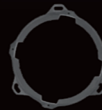
X-180S専用アルミバッフルボード