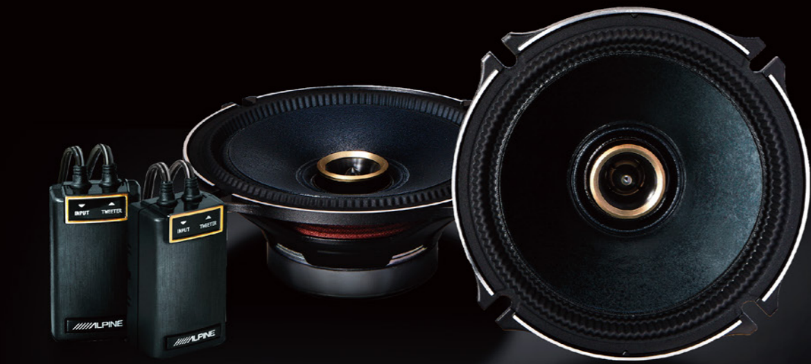
17cmコアキシャル2WAYスピーカー