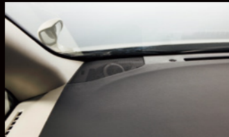
最適な位置・角度に取付けられる「ツイーター取付けキット」