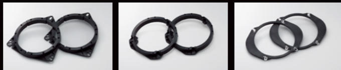
トヨタ/ニッサン用 ホンダ用 マツダ用