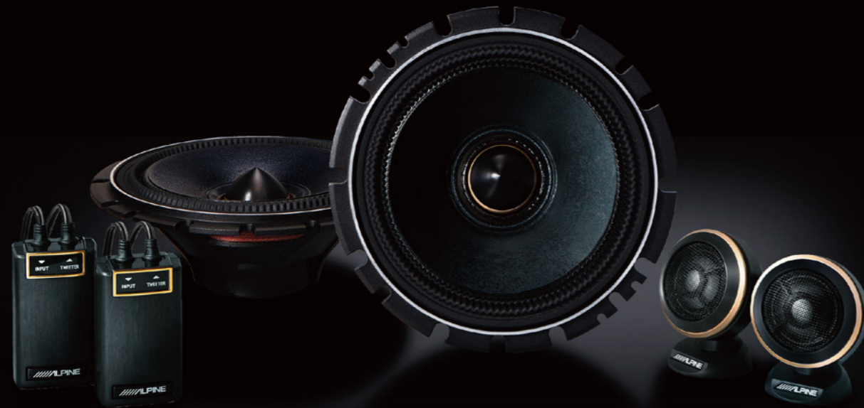
16cmセバレット2WAYスピーカー (2.5cmグラファイトツイーター/専用ネットワーク付属)