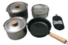
スノーピーク フィールドクッカー PRO.3