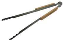
スノーピーク 火ばさみ