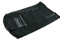
コールマン ドライバッグ