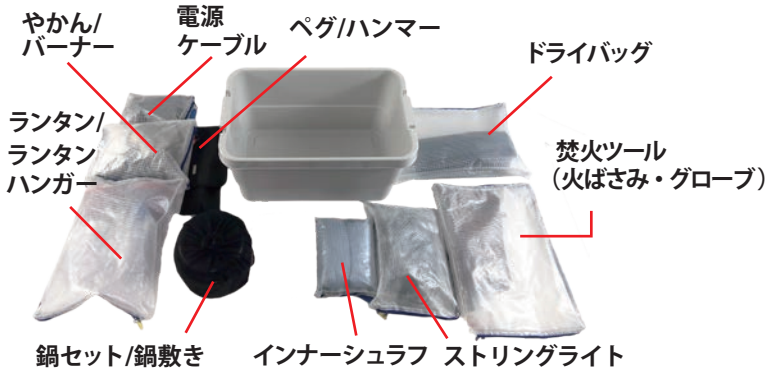
やかん/ バーナー ランタン/ ランタン ハンガー