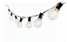
ビーネイチャー Stringライト(5.5m)