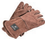
スノーピーク ファイヤーサイドグローブ UG-023BR