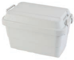
無印良品 ポリプロピレン 頑丈収納ボックス・大