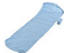
イスカ シュラフシートSZ