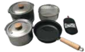
スノーピーク フィールドクッカー PRO.3