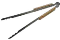
スノーピーク 火ばさみ