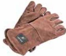
スノーピーク ファイヤーサイドグローブ UG-023BR