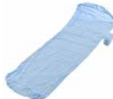
イスカ シュラフシーツSZ