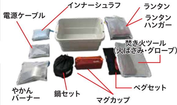
電源ケーブル インナーシュラフ ランタン ランタン ハンガー 焚き火ツール (火ばさみ・グローブ) やかん バーナー 鍋セット マグカップ ペグセット