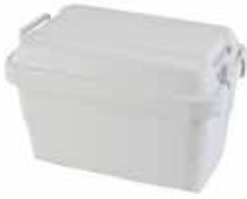
無印良品 ポリプロピレン 頑丈収納ボックス・大