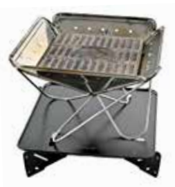
焚き火台 スノーピーク 焚火台Mスターターセット SET-111