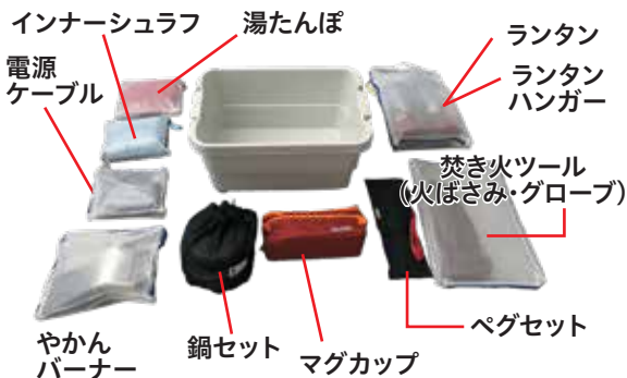
インナーシュラフ 湯たんぽ 電源ケーブル ランタン ランタンハンガー 焚き火ツール (火ばさみ・グローブ) やかん バーナー 鍋セット マグカップ ペグセット