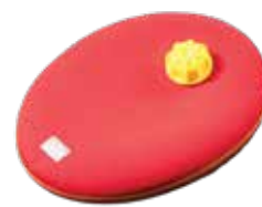
Cloz やわらかゆたんぽ