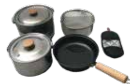
スノーピーク フィールドクッカー PRO.3