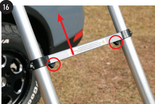
はしごの上段側の各ステップ下側にある黒い突起を押して、長さの調整をします。