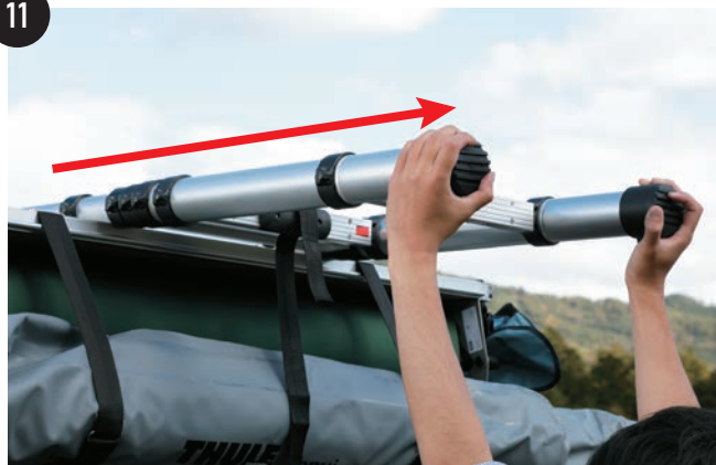
助手席側から手前にはしごを引っ張り、ステップが全て出るまで伸ばしていきます。