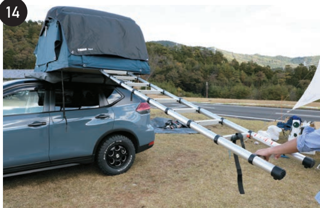
写真のようにテントを開きます。