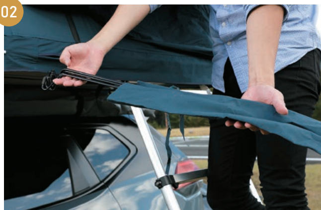
02 助手席側、運転席側、前方側、後方側の各側面のポールを8本(各面2本ずつ)を全て外して、ケースにしまえます。