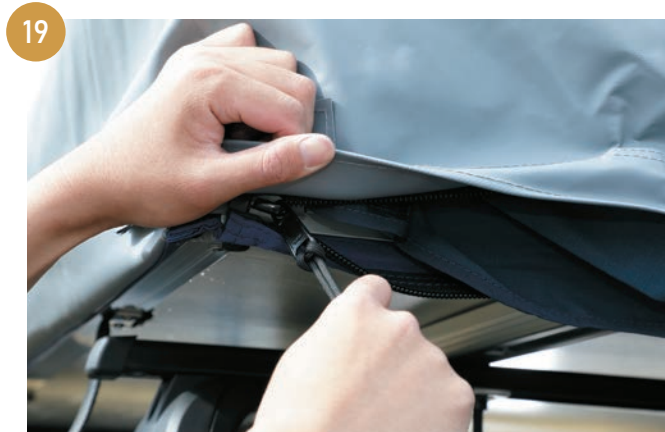
助手席の後方側にある角のマジックテープを外し、本体とファスナーで固定していきます。

※ファスナーで留める際にルーフトップテントとの噛み込みに注意しながら留めてください。