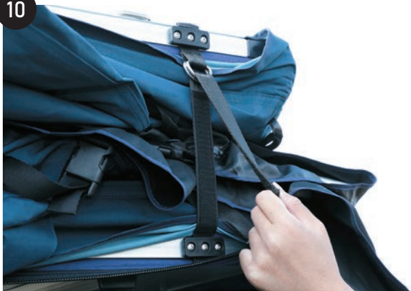
運転席側の前方側、後方側の2か所にあるマジックテープを外します。