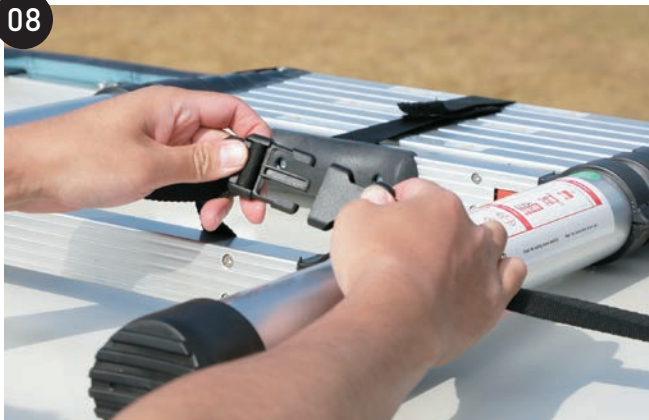
運転席側からはしごを固定しているサイドリリースバックルとはしごのステップを固定しているマジックテープを外します。