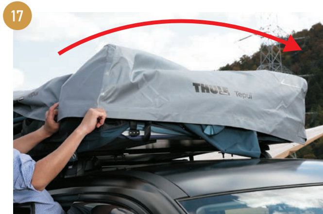
助手席側にあるカバーを固定しているマジックテープを外して、運転席側にカバーをかけていきます。