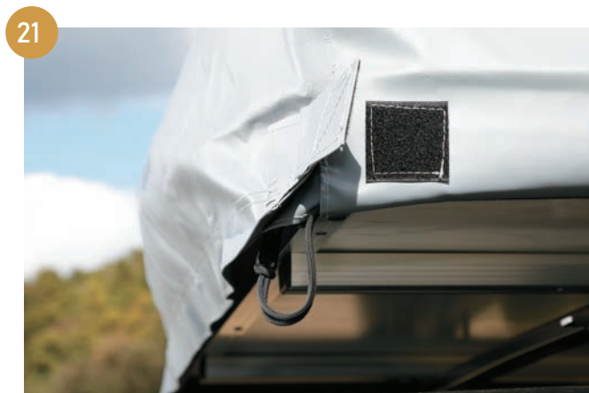
助手席の進行方向側までファスナーで留めた後、ファスナーをカバー内側へ収納し、マジックテープで固定します。