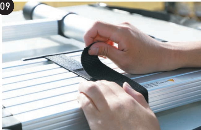
助手席側からはしごを固定しているマジックテープを外します。