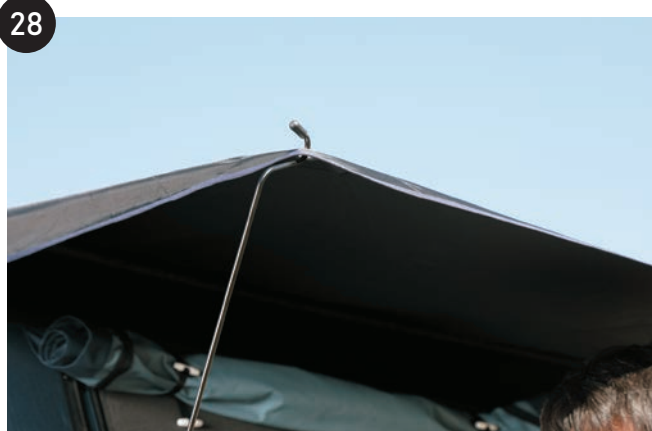
黒いレインフライの左右2か所にあるホール(展開時に留めていたホール)に先端のフックを引っ掛けて、ポール部分をたわませて取り付けます。