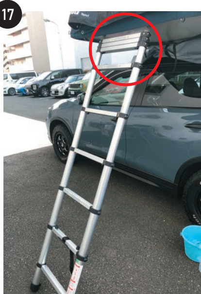
余ったはしごのステップは上段にスライドさせます。カチッと音が鳴るまでスライドさせ固定してください。