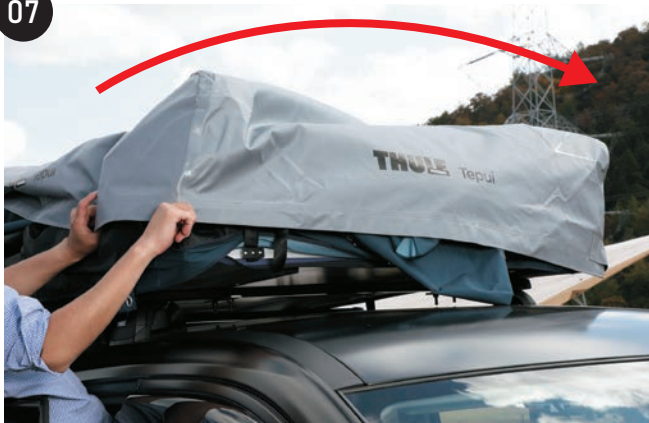
運転席側から矢印の方向(助手席側)にグレーのカバーを外します。