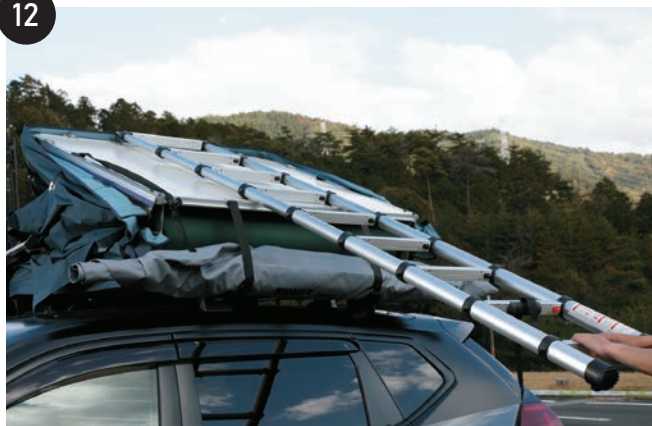
はしごを手前に引いて、折りたたんである床面を手前に持ってきます。