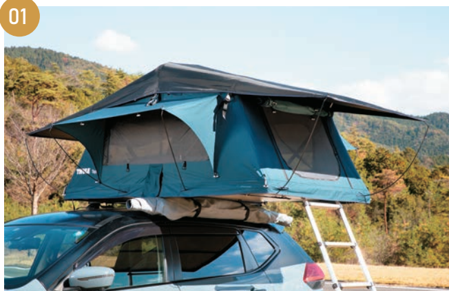
01 助手席側、運転席側、前方側、後方側の各側面のポールを8本(各面2本ずつ)を全て外して、ケースにしまえます。