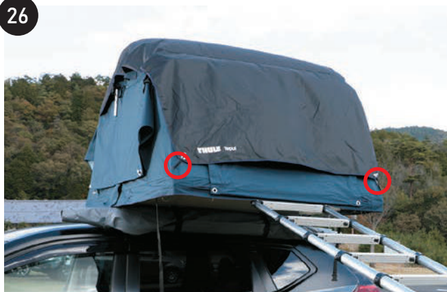
助手席側、運転席側の下側にあるホール2か所合計4か所にポールを奥までしっかり差し込みます。