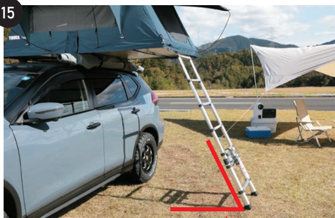
テントが開いた後ははしごを地面と60度の角度で設置します。