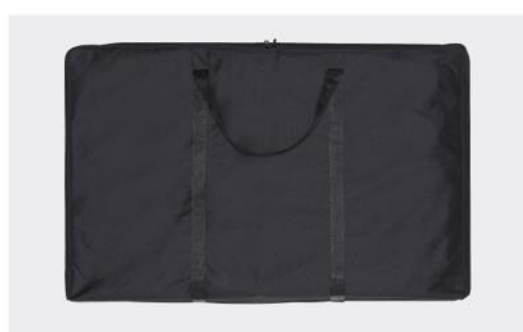
ベッドとフレームの持ち運びに便利なキャリーバッグも付属