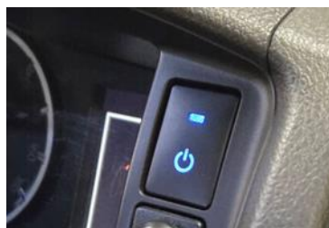
KCE-PS-Y01 のハイエース装着イメージ

トヨタ車向けポータブル電源用車両連携ハーネス KCE-PS-Y01（オープン価格）