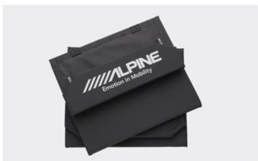
ベッド部はコンパクトな折りたたみタイプ

クッションとフレームを収納するキャリーバッグを付属。クルマでの持ち運びが便利です。