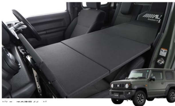
ジムニーでの使用イメージ